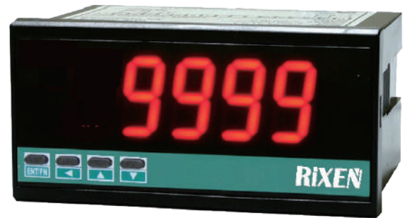
No.740RN 數字顯示控制器(選購)